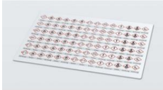
Planche d'étiquettes avec mentions d'avertissement selon le SGH