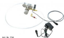
Art. No. 736

Détendeur d'alimentation hydrogène (200 bar) avec réducteur de pression et électrovanne pour alimentation pile Nexa Training System ou remplissage des réservoirs d'hydrure