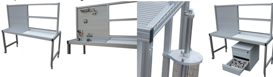
Table pneumatique mobile double ou simple avec 2 panneaux de montage, cadre format A4 2 étages En option meuble de rangement sur roulettes EWTIDLW-016