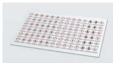
Planche d'étiquettes avec mentions d'avertissement selon le SGH